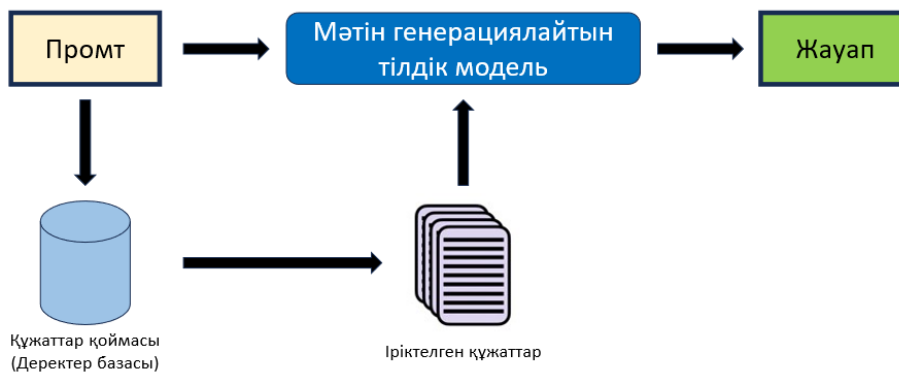
Сурет 2 – RAG моделінің кәсіпорынның электрондық құжат айналым жүйелеріндегі жұмыс істеу схемасы

RAG моделінің жұмыс істеу үдерісі бірнеше негізгі кезеңнен тұрады. Алдымен кәсіпорынның құжаттары мәтіндік өңдеуден өткізіліп, семантикалық векторларға түрлендіріледі. Бұл кезеңде embedding модельдері қолданылады, нәтижесінде әрбір құжат векторлық кеңістікте ұсынылады. Кейін бұл векторлар арнайы векторлық дереккорда сақталады. 2-суретте көрсетілген модель бойынша пайдаланушы табиғи тілде сұраныс енгізген кезде, сұраныс та векторлық формаға келтіріліп, семантикалық ұқсастық негізінде ең релевантты құжаттар немесе мәтін үзінділері таңдалып алынады [7].