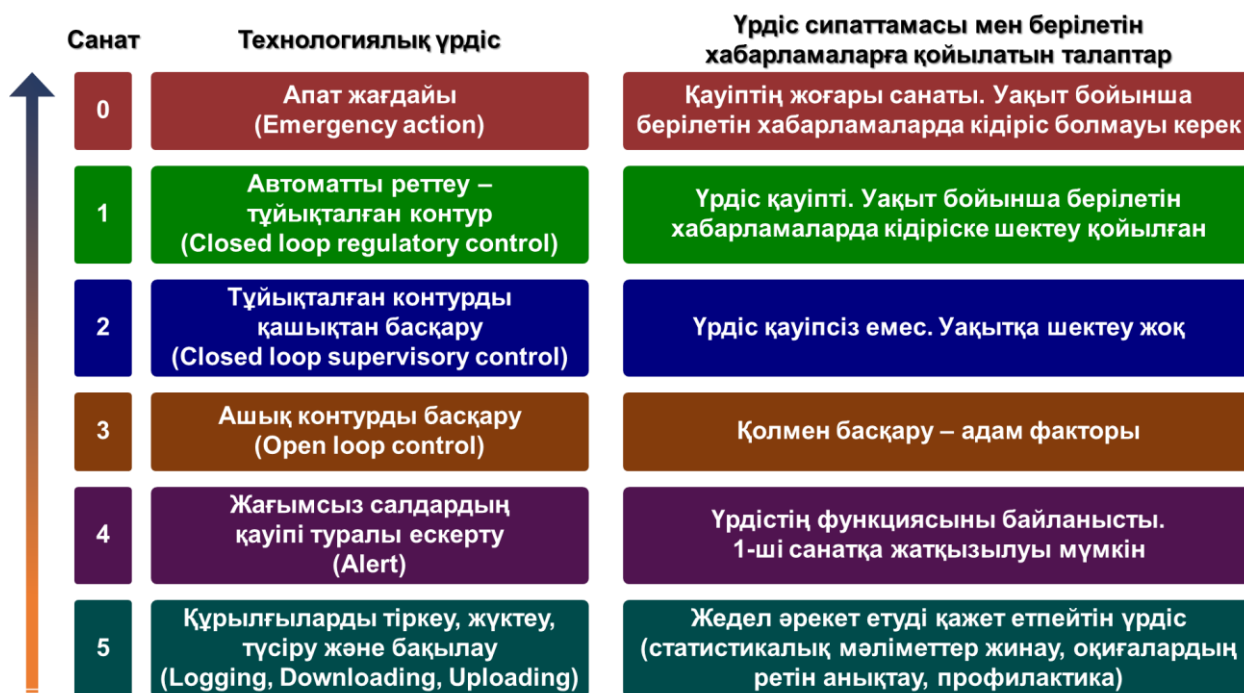
Сурет 1. Технологиялық үрдістер мен хабарламалардың санаттық қағидаты

Кәсіпорынның автоматтандырылған технологиялық басқару жүйелері үшін сымсыз технологияны таңдауға жауапкершілікпен қарау керек, өйткені бұл өте сенімді және оны кәсіпорында да жүзеге асырылуы мүмкін басқа сымсыз шешімдермен үйлесімі болуы керек, сондықтан технологиялық үрдістерді басқарудың автоматтандырылған жүйелері үшін ең қолайлы, ең аз энергияны тұтынумен, жоғары жылдамдықты жеке желілерге арналған, секундына 250 Мбит жылдамдық өрбітетін, «жұлдызша», «нүкте-нүкте», «ұяшықты» желі құру топология шешімдерін қарастырамыз.